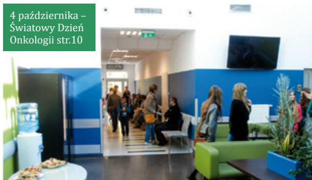
4 października – Światowy Dzień Onkologii str.10