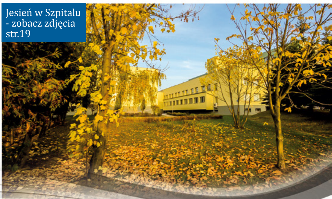
Jesień w Szpitalu - zobacz zdjęcia str.19