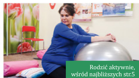
Rodzić aktywnie, wśród najbliższych str.5