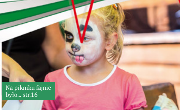
Na pikniku fajnie było... str.16