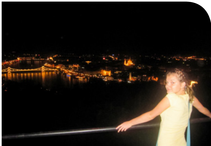
Góra Gellerta zdobyta!

Wakacje 2014 nieuchronnie minęły, my jednak postanowiliśmy zatrzymać je w fotograficznym kadrze. Jak się okazało, fotografia jest pasją wielu pracowników naszego szpitala. Wakacyjne zdjęcia tych, którzy zechcieli podzielić się z nami swoimi letnimi wspomnieniami, trafiły na wystawę pn. „Moje najpiękniejsze zdjęcie z wakacji”. Można je oglądać w gablocie na parterze szpitala.