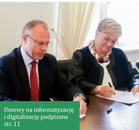
Umowy na informatyzację i digitalizację podpisane str. 11