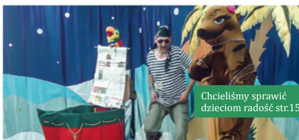
Chcieliśmy sprawić dzieciom radość str.15