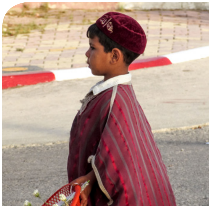
Tunezja. Mały sprzedawca kwiatów.