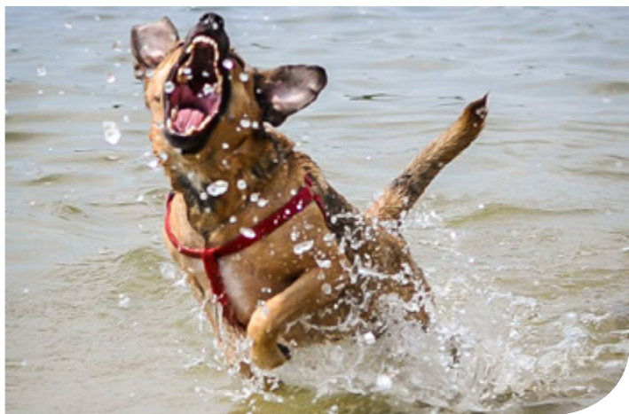
Psie szaleństwo.