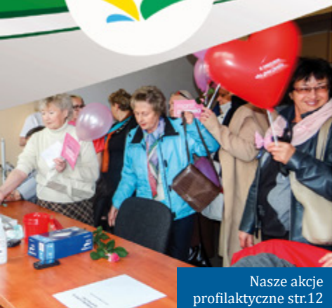
Nasze akcje profilaktyczne str.12