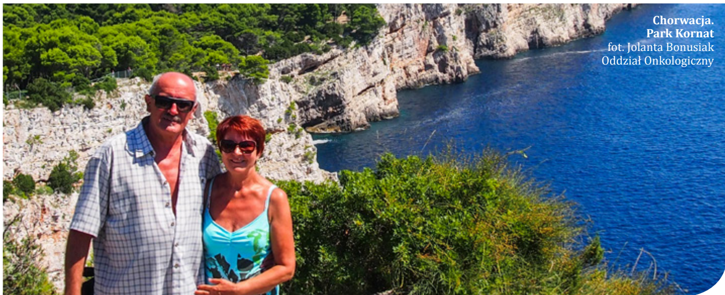
Chorwacja. Park Kornat fot. Jolanta Bonusiak Oddział Onkologiczny